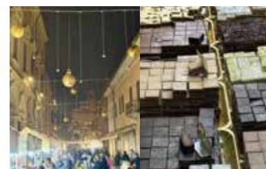
Puro Cioccolato Festival