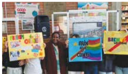
Premio Internazionale per i Diritti Umani Daniele Po XVII edizione