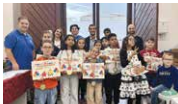
Festa sociale AVIS 67° Compleanno