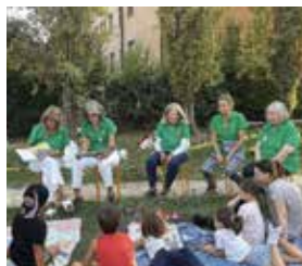
Le pulcette in giardino Associazione Tararà tararera