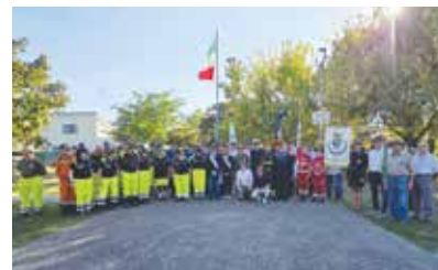
11° Anniversario del Giardino degli Alpini