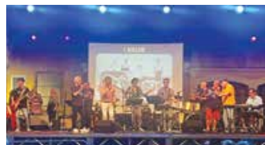
Un Pop di Beat! La 100 Beat e i suoi complessi