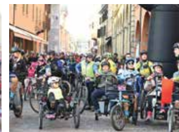
Valli per Giulio