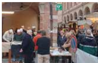
Festa della Castagna Pro Loco di Cento