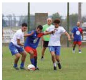
VII Trofeo Bimbilacqua