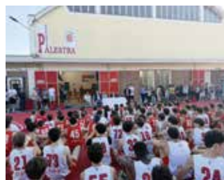
30 anni della Benedetto 1964