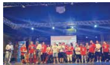
Diversamente Artisti Fondazione Zanandrea