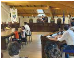
Cerimonia conferimento Cittadinanza italiana