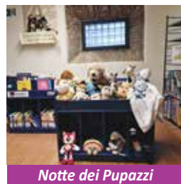
Notte dei Pupazzi in Biblioteca