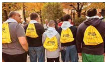
Passi fuori dal Comune