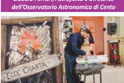
Finissage di Chartae doloris, installazione di Alessandro Ramin presso la Chiesa di San Lorenzo