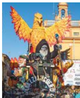
I ragazzi del Guercino