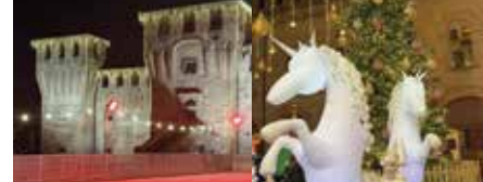
Meraviglioso il Natale a Cento 2025