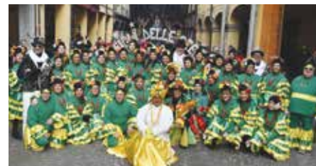
Figli delle Stelle