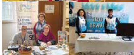
2ª fiera delle Associazioni a Renazzo