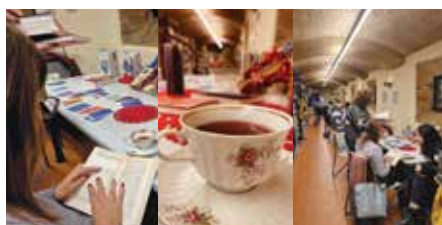
Silent reading party - Un tè con Jane Austen