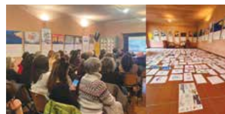
Mostra su Jella Lepman